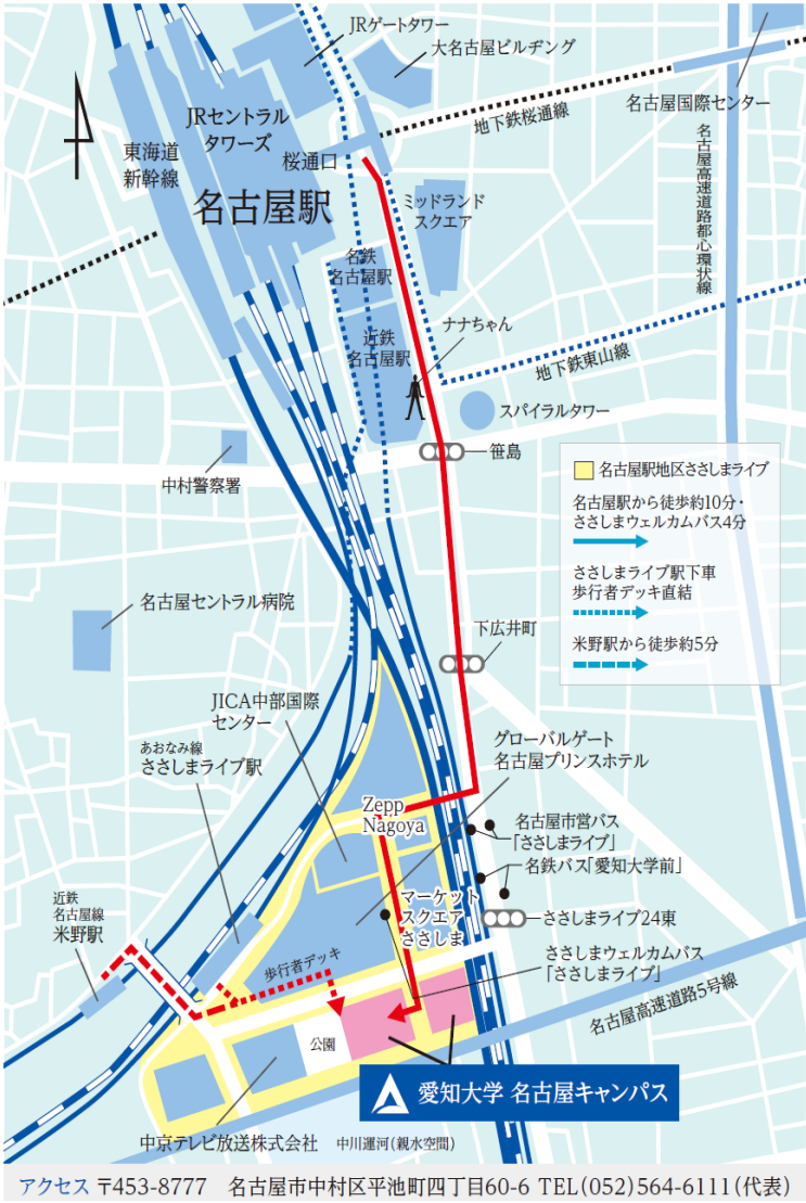
名古屋校舎試験場アクセスマップ